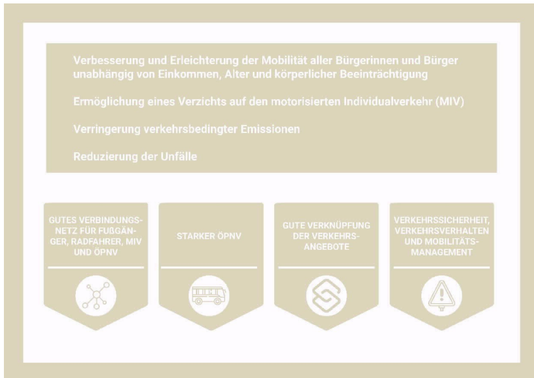
Abbildung 3: Ziele und Handlungsfelder

Die Handlungsfelder des Mobilitätskonzeptes wurden aus der Analyse sowie den Leitzielen abgeleitet. Dabei zielt jedes von ihnen auf die Erreichung mindestens eines Leitzieles ab. Durch die Zuordnung der Handlungsfelder zu den Leitzielen können diese in konkrete Maßnahmenpakete überführt werden. Die nachfolgende Abbildung gibt eine Übersicht über das Zusammenwirken von übergeordneten Zielen und Handlungsfeldern: